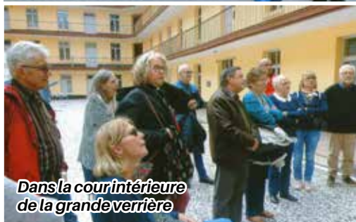
Dans la cour intérieure de la grande verrière