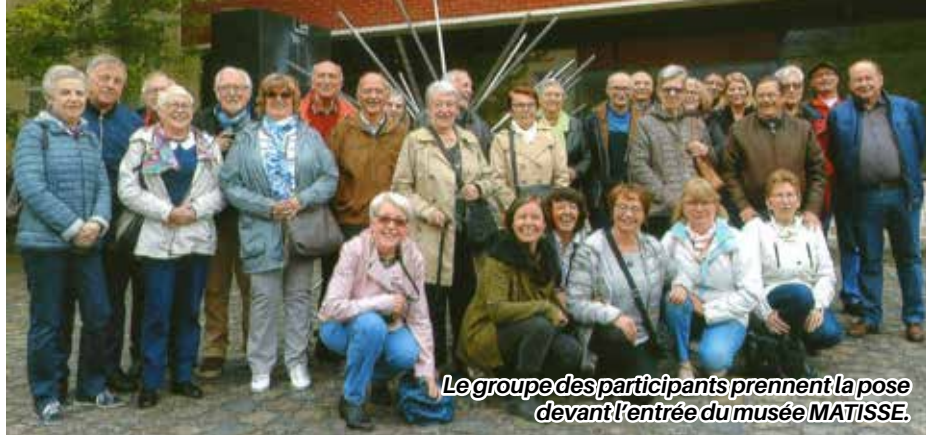
Le groupe des participants prennent la pose devant l'entrée du musée MATISSE.