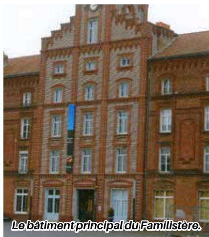
Le bâtiment principal du Familistère.

La trentaine de participants prend place dans le car, direction « Le Cateau-Cambrésis ».