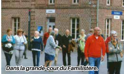
Dans la grande-cour du Familistère.

Sans doute un peu des deux...peut-être une prison dorée ?