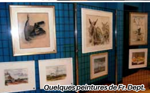
Quelques peintures de Fr. Dept.